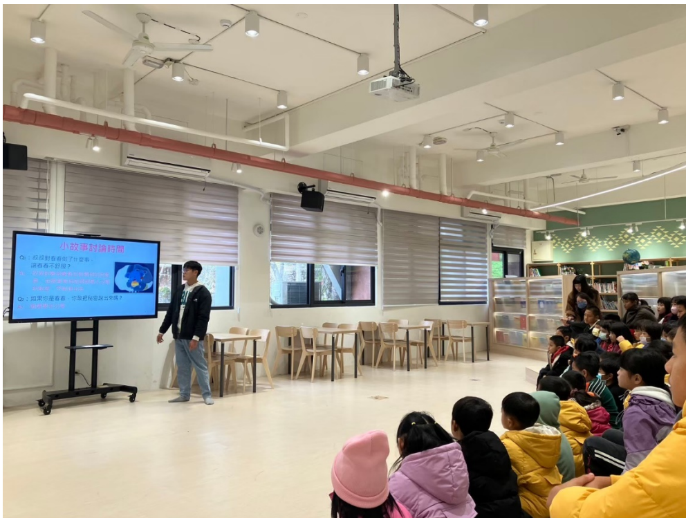
照片說明：透過影片請同學省思身體自主權的重要性，並主動提出自己的看法，建立尊重自己與他人身體的觀念。