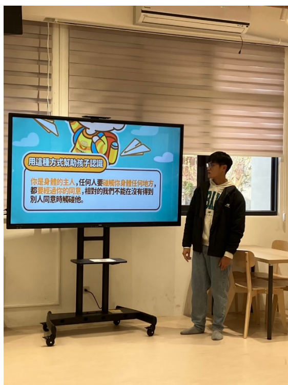
照片說明：透過互動遊戲讓學生了解身體哪些地方是不能隨意被他人觸摸，無論是陌生人或熟人都不得侵犯，同樣也不經同意對他人做出侵害身體自主權的行為。